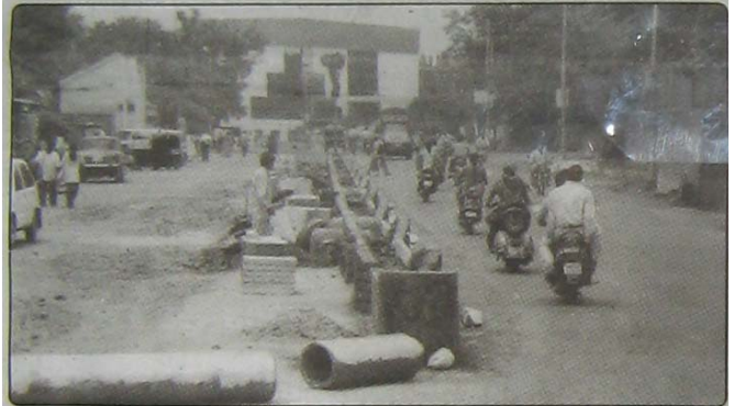
लोकमान्य हॉस्पिटल ते चाफेकर चौक येथील वाहतुकीत सुरळीतपणा यावा यासाठी रस्त्याच्या मध्यभागी रस्तादुभाजकाची उभारणी करण्यात आली आहे. यासाठी १२ लाख ४३ हजार रुपये खर्च करण्यात आला आहे.