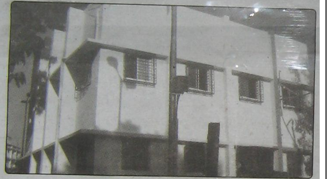
श्रध्दा गार्डन, गावडे कॉलनी येथे २० लाख रुपये खर्च करून भव्य कर संकलन इमारत उभारण्यात आली आहे. अनेक वर्षांपासून या वास्तूची नगरीला आवश्यकता होती ती यानिमित्ताने पूर्ण करण्यात आली.