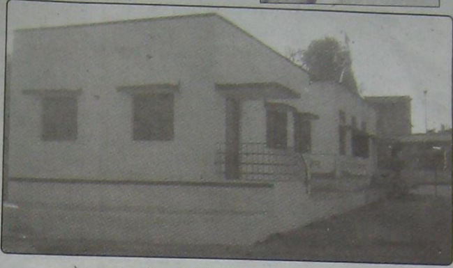
उदयोनगर (दळवीनगर) येथे विविध कार्यक्रमांसाठी उपयुक्त अशा सांस्कृतिक हॉलची उभारणी करण्यात आली आहे. सध्या या टिकाणी बचत गटामार्फत विविध योजनांचे प्रशिक्षण दिले जाते.