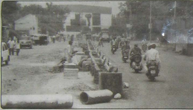
लोकमान्य हॉस्पिटल ते चाफेकर चौक येथील वाहतुकीत सुरळीतपणा यावा यासाठी रस्त्याच्या मध्यभागी रस्तादुभाजकाची उभारणी करण्यात आली आहे. यासाठी १२ लाख ४३ हजार रुपये खर्च करण्यात आला आहे.