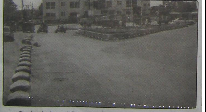
लिकरोड ते मोरया हॉस्पिटलकडे जाणाऱ्या रस्त्यांमध्ये रस्तादुभाजक टाकण्यात आला आहे. यामुळे या भागातील वाहतुक व्यवस्थेला शिस्त प्राप्त झाली असून अपघातांच्या प्रमाणालाही आता आळा बसला आहे.