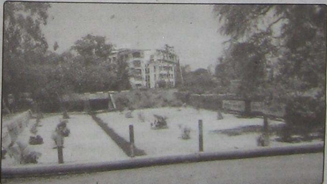
उदयोनगर येथील रेल्वे क्वार्टरजवळील नाल्याचे अतिशय मनोवेधक पध्दतीने सुशोभिकरण करण्यात आल्याने या परिसराला एक अल्हाददायकपणा प्राप्त झाला आहे. त्यामुळे येथील अस्वच्छता संपुष्टात आल्याचे चित्र आहे.