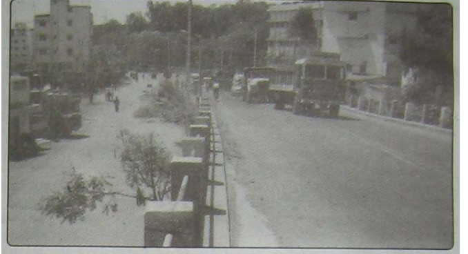
लोकमान्य हॉस्पिटल जवळील पुलाचे विस्तारीकरण करुन येथील पहिल्या एकपदरी पुलाचे आता दुपदरी पुलामध्ये रुपांतर करण्यात आले आहे. यामुळे येथील वाहतुक व्यवस्थाही आरा सुरळीत झाली आहे.