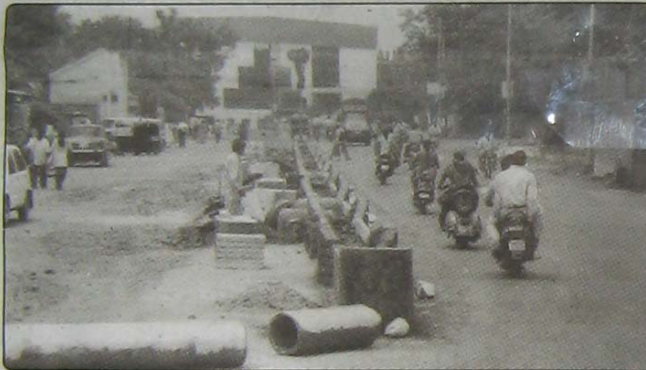
लोकमान्य हॉस्पिटल ते चाफेकर चौक येथील वाहतुकीत सुरळीतपणा यावा यासाठी रस्त्याच्या मध्यभागी रस्तादुभाजकाची उभारणी करण्यात आली आहे. यासाठी १२ लाख ४३ हजार रुपये खर्च करण्यात आला आहे.